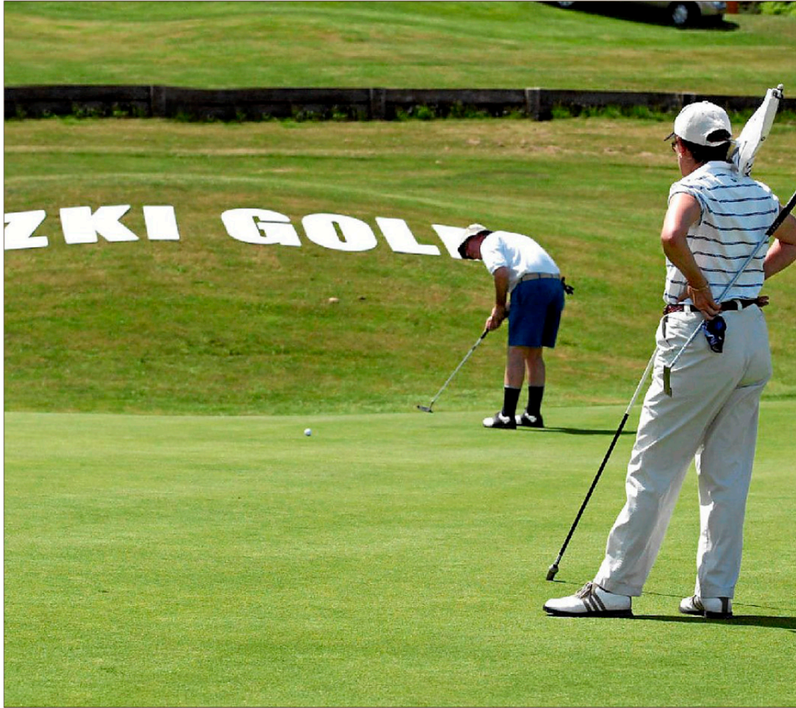
El club alavés de Izki es uno de los que apuestan por combinar el golf con el vino de la Rioja Alavesa.

Esta creciente simbiosis no ha pasado desapercibida y su poten-