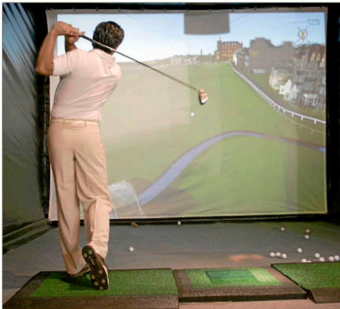
Un jugador sigue la trayectoria virtual de su bola en un simulador de golf.

No hace mucho que los presentes en la gala de los premios Driver que anualmente organiza la Federación Vasca de golf, pudieron comprobar lo útil y divertido que puede resultar un simulador, en aquel caso con el propio Ballesteros y Olazabal como protagonistas. El artilugio que se utilizó en el palacio Euskalduna lo suministra EverGolf, una prestigiosa empresa de instalación de elementos de golf, que actualmente se encuentra