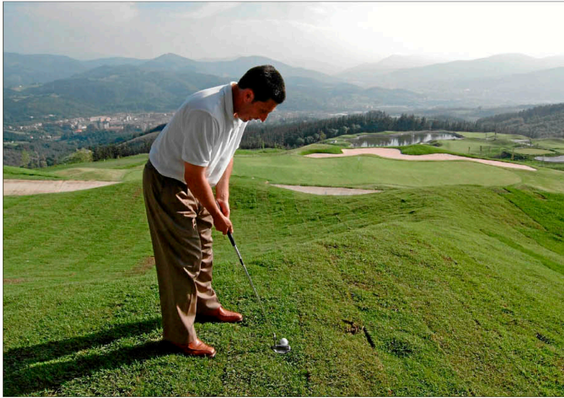
Txema Olazabal realiza el golpe inaugural en el campo del Club de golf Artxanda en mayo de 2006.

«Hemos cerrado tratos con empresas suministradoras y de material duro y ya son varias primeras marcas las que se pueden consumir en las propias instalaciones. Estamos rematando el campo, madurando todos los sistemas de riego, hemos construido un puente entre los hoyos 5 y 6 porque resultaba muy incómodo para los jugadores y que cruza la carretera. Estamos terminando de colocar las últimas pasarelas de se-