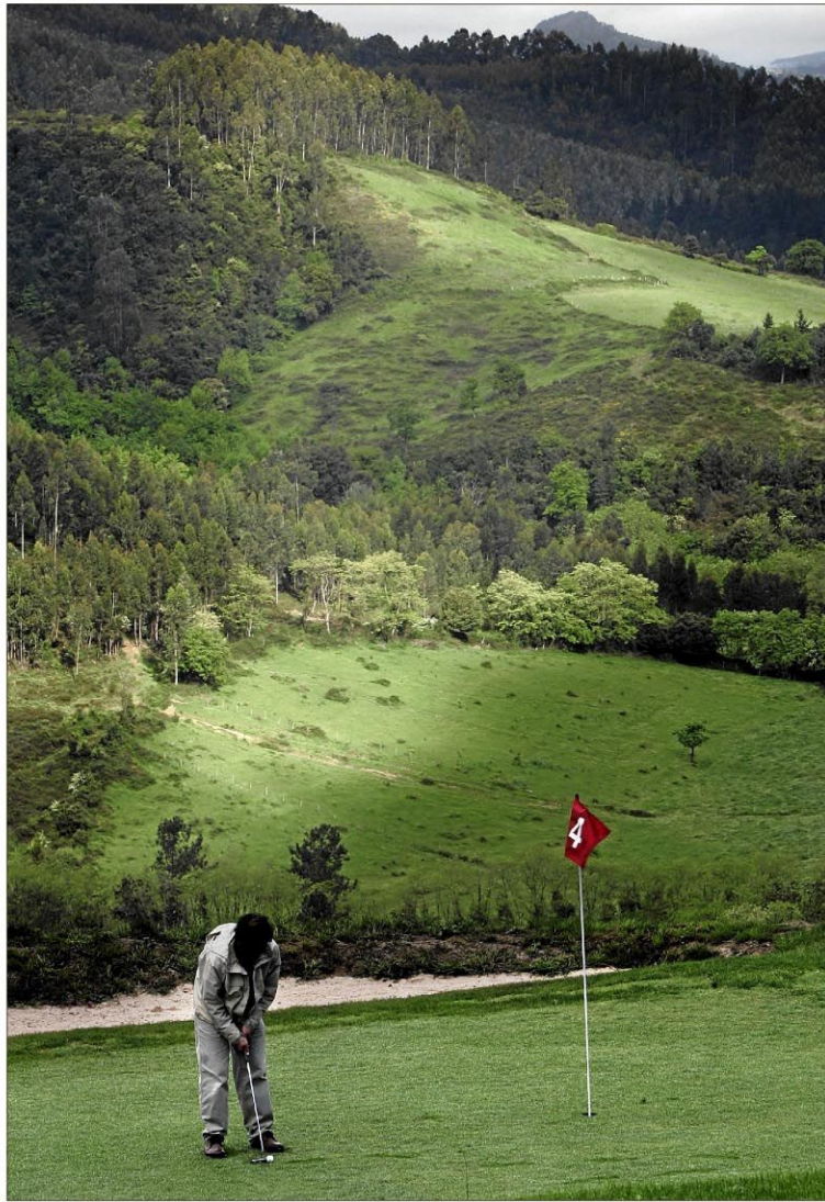
Un golfista realiza un putt dentro del «green». / IÑAKI ANDRÉS

«No sólo somos los responsables de que el césped esté impecable, sino que hay muchas más actividades de mantenimiento y más zonas